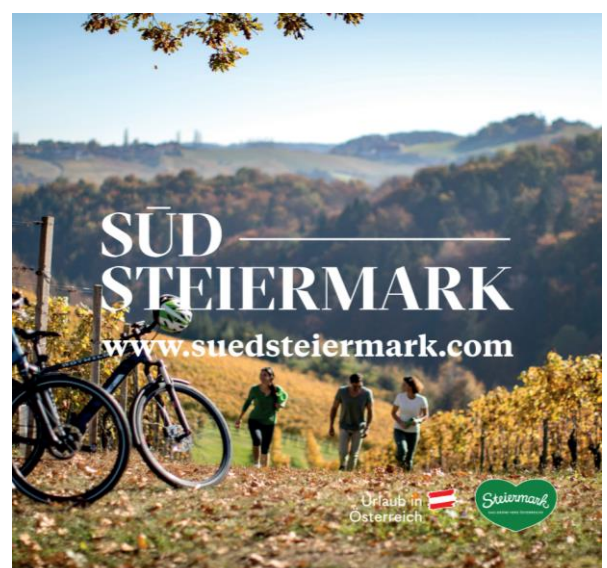
Abb. 14: Messepult "Rad"