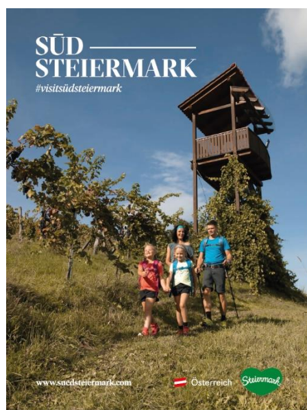
Abb. 10: Roll up XXL "Familie"