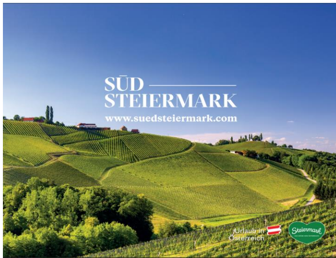
Abb. 16: Messerrückwand "Weingarten" (3000 x 2500 mm)

PIXLIP GO Lightbox inkl. 2x Digitaldruck, Rahmenkonstruktion, LED-Module inkl. Netzstecker, Verstrebungen, Tragetaschen, Fußplatten und allen benötigten Verbindern