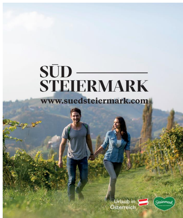
Abb. 19: Messerückwand "Wandern" (2000 x 2500 mm)

PIXLIP GO Lightbox inkl. 2x Digitaldruck, Rahmenkonstruktion, LED-Module inkl. Netzstecker, Verstrebungen, Tragetaschen, Fußplatten und allen benötigten Verbindern