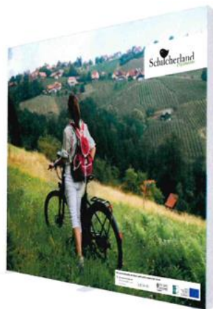
Größe: 3000 x 2500 mm