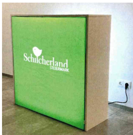
Abb. 15: Messepult (Farbauswahl: rot, gelb, grün & schwarz)