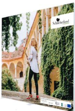
Größe: 3000 x 2500 mm