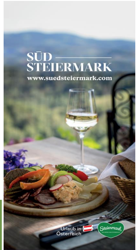
Abb. 2: Roll up "Kulinarik & Wein"