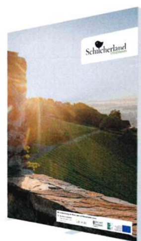
Größe: 2000 x 2500 mm