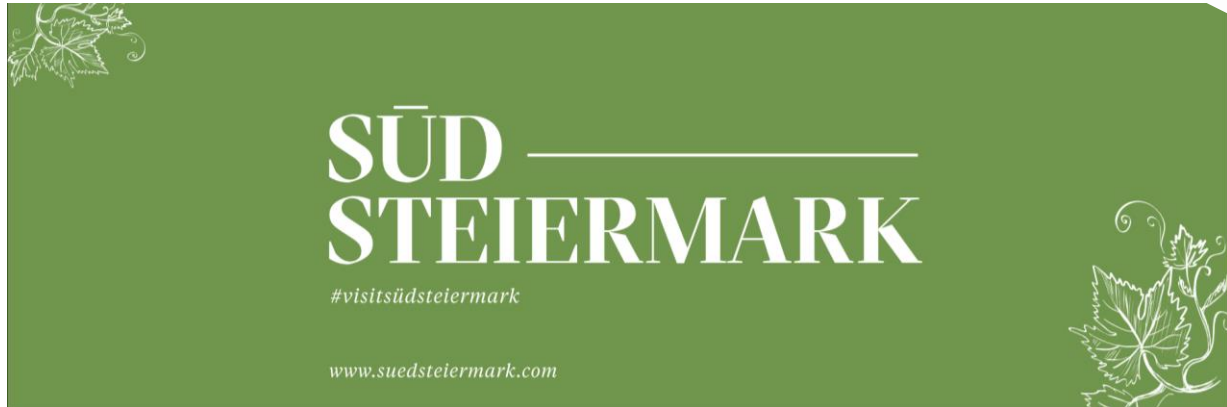
Abb. 11: Transparente "Südsteiermark"

2 Stück vorhanden; Maße: 3 x 1 m; Ösenmontage