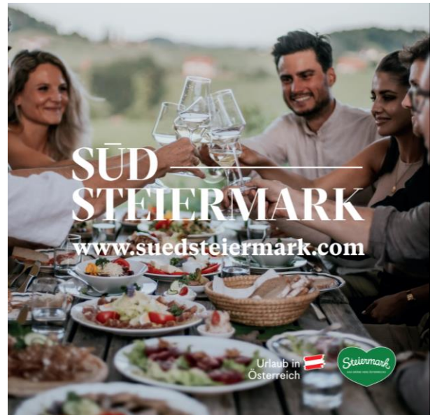
Abb. 12: Messepult "Kulinarik"