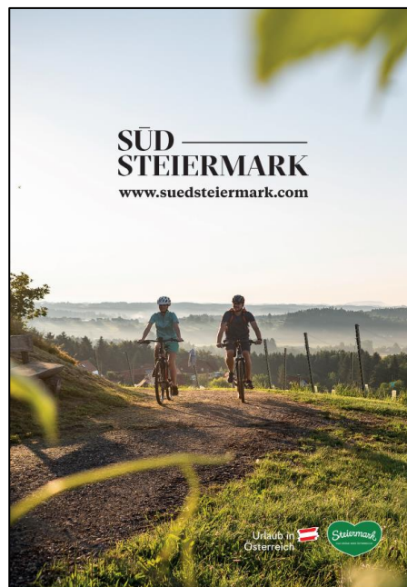
Abb. 8: Roll up XXL "Rad"