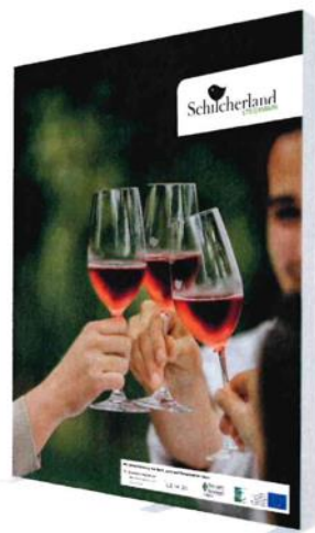
Größe: 2000 x 2500 mm