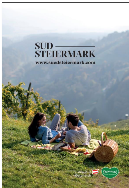
Abb. 7: Roll up XXL "Picknick"