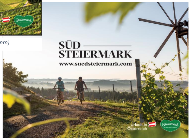
Abb. 17: Messerrückwand "Rad" (3000 x 2500 mm)