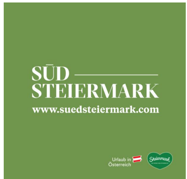
Abb. 13: Messepult "grün"